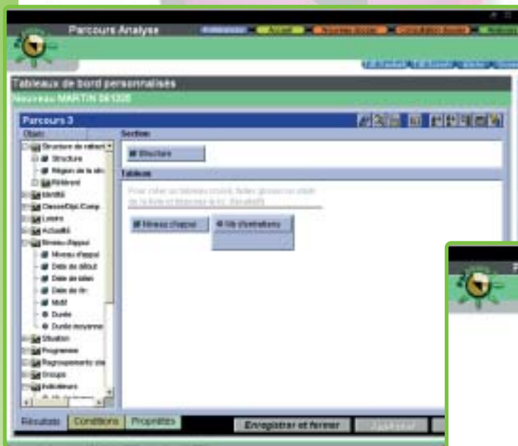
Requête Business Objects

Des tableaux de bord peuvent être paramétrés en fonction des besoins locaux : ils permettent d'analyser l'accueil et les services proposés aux jeunes.